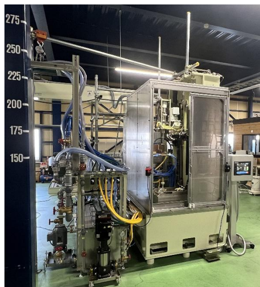
△デュアルシフト方式縦型熱処理設備