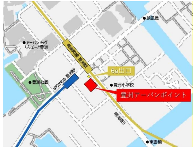
△豊洲アーバンポイント所在地