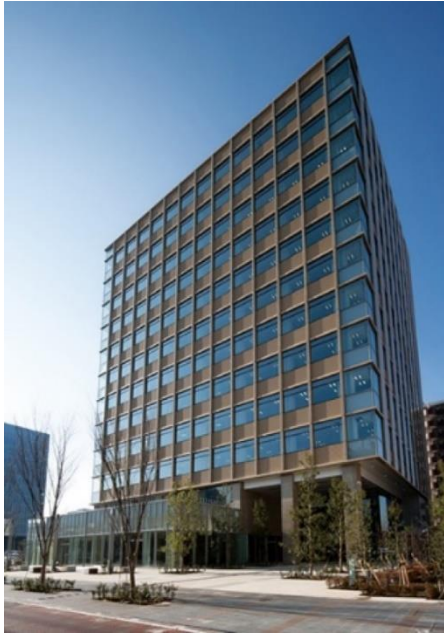
△豊洲アーバンポイント外観