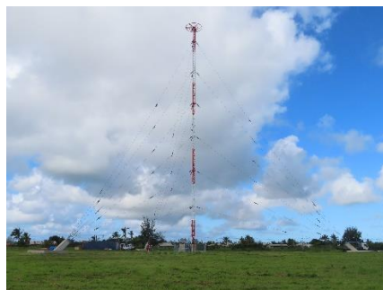
《 全 景 》