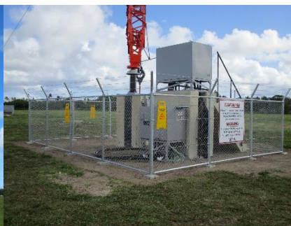
《 局 舎 》