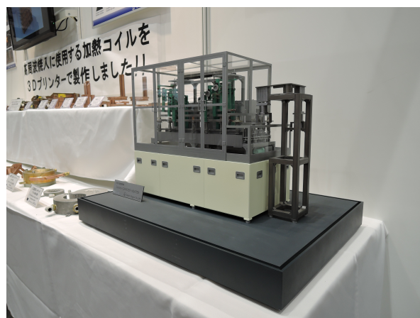
トンネル式高周波焼戻装置(模型)