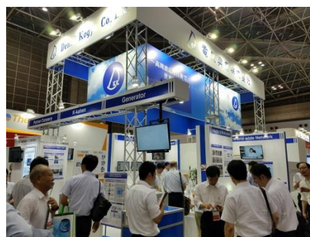
当社ブースの様子

ブースでは、メイン製品の展示に加え、弊社海外事業の紹介や、様々なカットワーク・コイルを展示いたしました。また、IoT技術の活用をご覧いただけるよう、弊社工場にある設備と会場を繋ぎ、ご紹介いたしました。当社社員による製品説明も行い、ご来場いただいたお客様より大きな関心を頂戴いたしました。