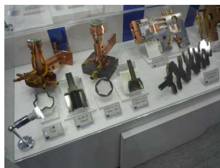
コイル・カットサンプルコーナー